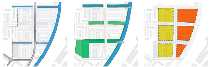
stap 1 Homerusstraat en waterrand